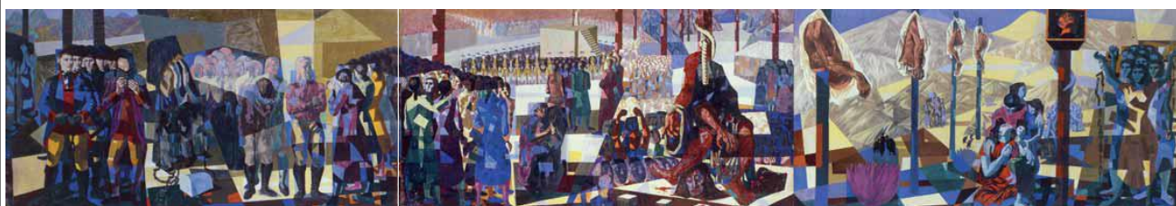
Candido Portinari. Tirandentes, 1948-1949. Painel, tempera sobre tela, 309 cm x 1.767 cm. Coleção Fundação Memorial da América Latina, São Paulo (SP).

1.4 – Fale sobre o imenso painel Tirandentes , produzido pelo artista Candido Portinari . (pag.34/35)