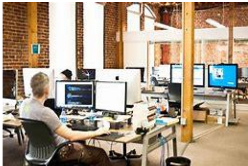
Fig. 1 _____

9. Escreva abaixo de cada figura se ela representa um shared office ou um home office .