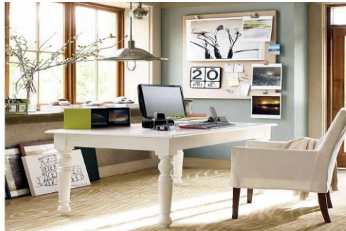
Fig 2. _____