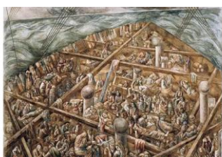
D – Navio de emigrantes

2.3 – Vicent van Gogn, um dos precursores do expressionismo, teria dito: