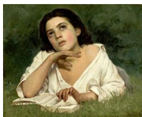
C – Moça com Livro