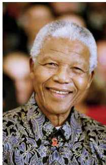
Caricatura de Nelson Mandela, ex-presidente da África do Sul. Acima, fotografia de Nelson Mandela.

2.4 – Observe as duas imagens ao lado e responda: Quais foram as características destacadas pela caricatura, na foto de Nelson Mandela?