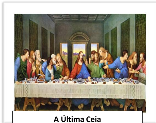
A Última Ceia

Pintada na parede do refeitório do convento de Santa Maria da Graça, em Milão (Itália), do artista de Leonardo da Vinci. A cena retrata uma época de um movimento artístico e cultural de qual período histórico: