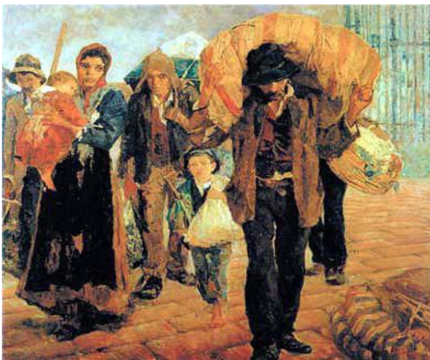
Imagem (pintura óleo sobre tela) - Antônio Rocco, Os imigrantes, 1919.

6. Observe a imagem e leia o texto a seguir: