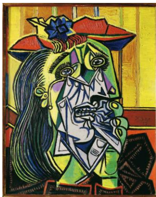
Mulher chorando, 1937