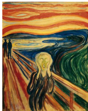
O grito, 1893