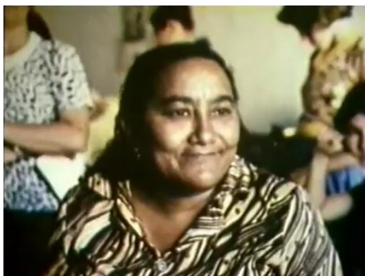
Who is she? _____