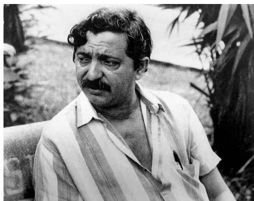
Who is he? _____

Na tabela abaixo, escreva MA quando se referir a Margarida Alves , ou CM quando se referir a Chico Mendes .